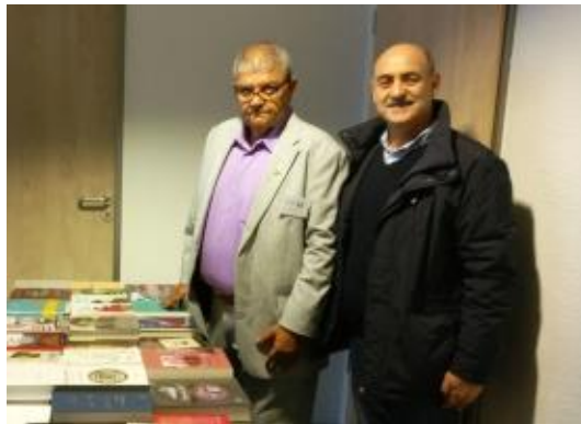
باقروند و بهبهانی در کارگاه آلترناتیوسازی نظام!