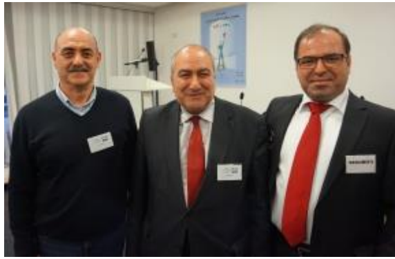
سه مزدور آلترناتیوساز نظام! وحدانی-حسین نژاد-باقروند