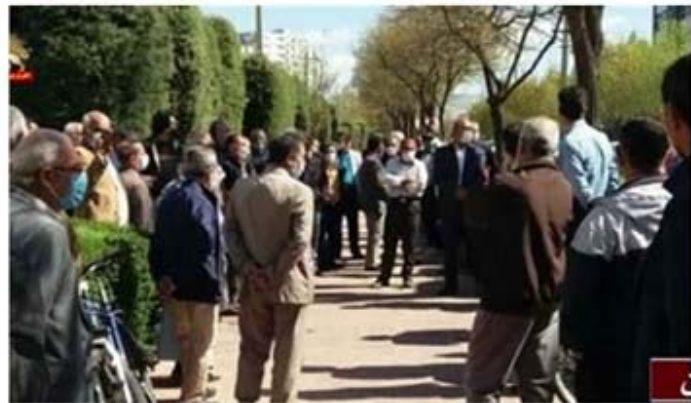
قزوین - Qazvin