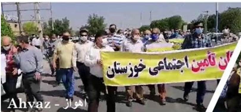
اهواز - Ahvaz