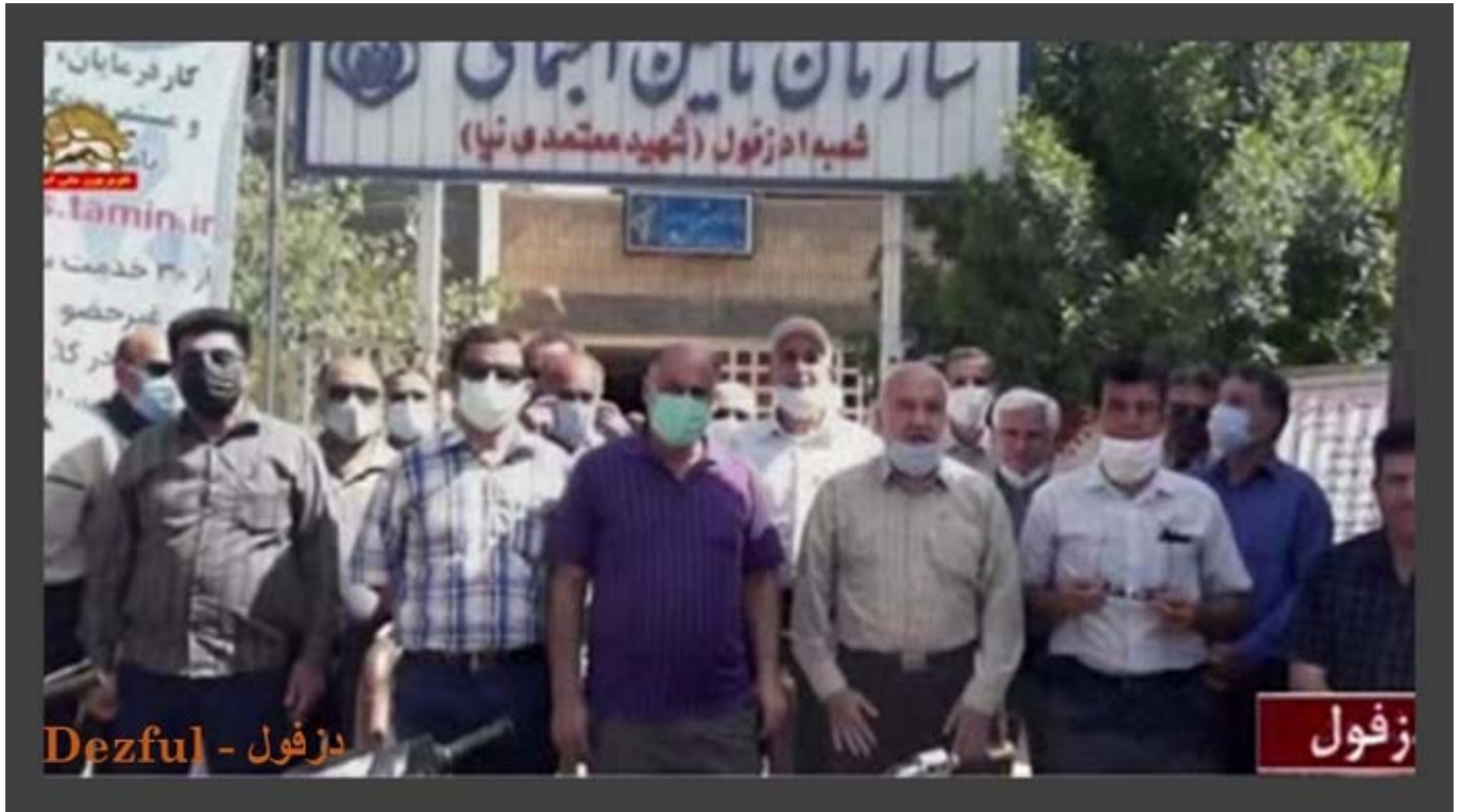
دزفول - Dezful