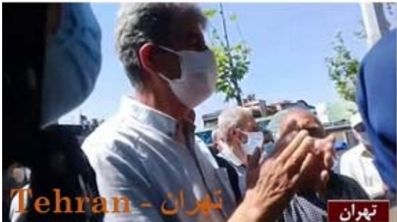
تهران - تهران