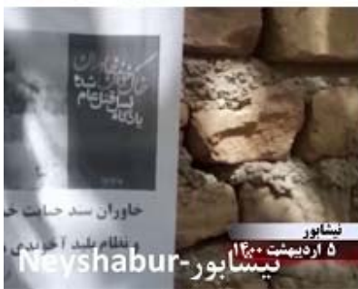
نیشابور ۵ اردیبهشت ۱۴۰۰ نیشابور - Neyshabur