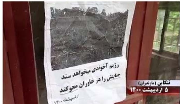
ننگابن (مازندران) ۵ اردیبهشت ۱۴۰۰