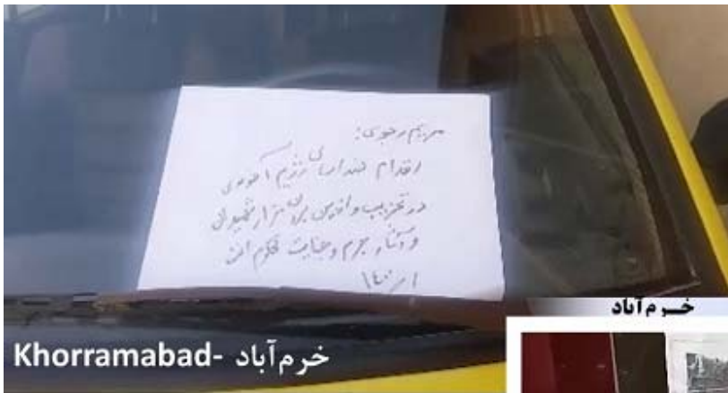
خرم آباد - Khorramabad