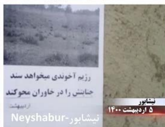
نیشابور ۵ اردیبهشت ۱۴۰۰ نیشابور - Neyshabur