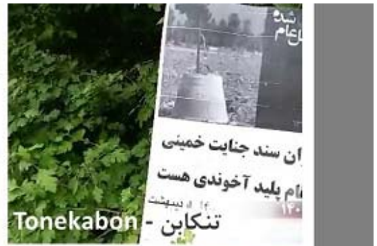
تنکابن - Tonekabon