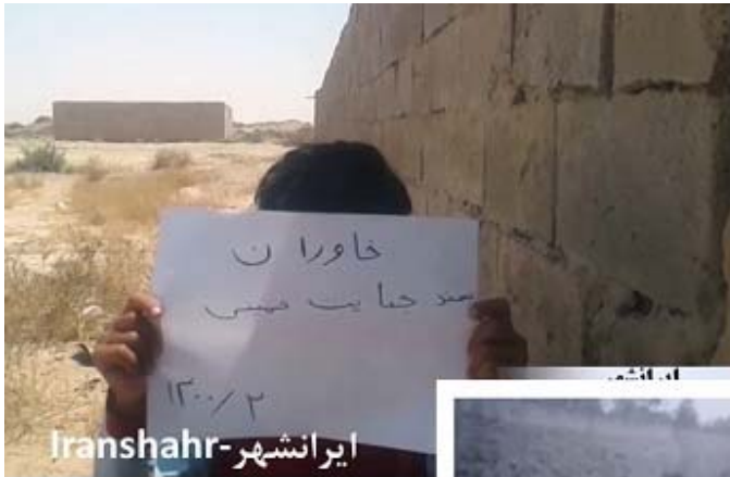
ایران شهر - Iranshahr