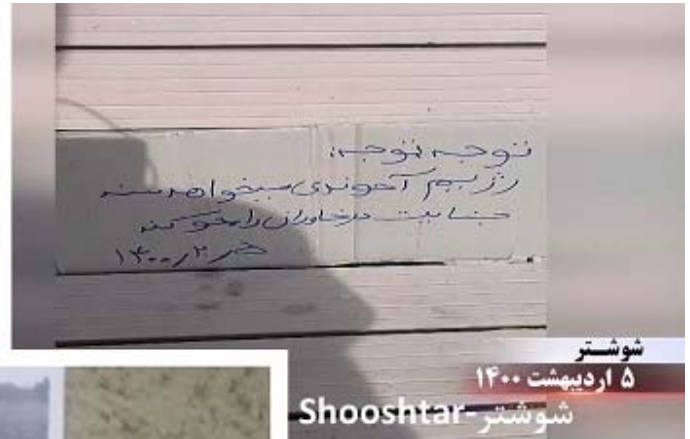
شوشتار ۵ اردیبهشت ۱۴۰۰ شوشتار - Shooshtar