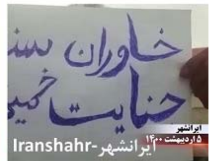
ایران شهر ۵ اردیبهشت ۱۴۰۰ ایران شهر - Iranshahr