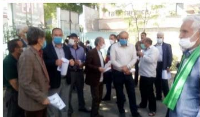
اردبیل - Ardabil