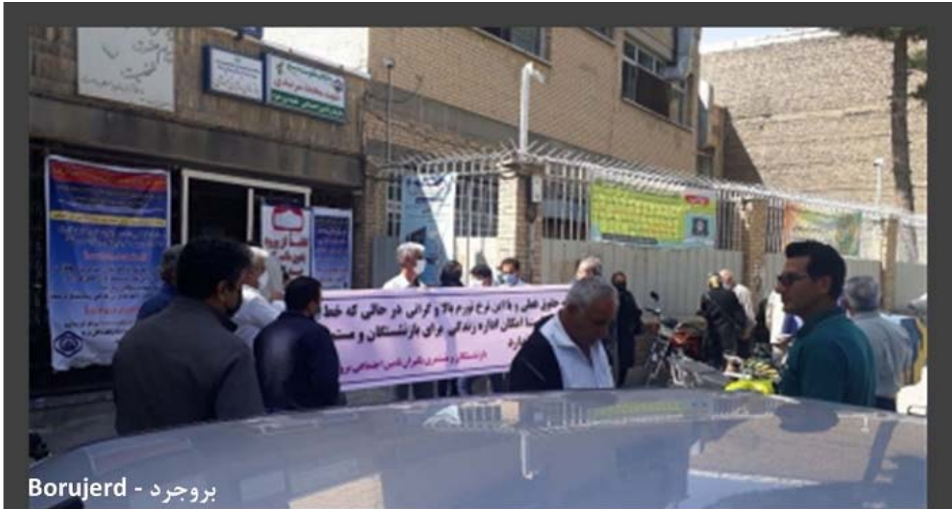
بروجرد - Borujerd