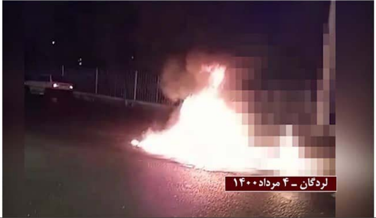
Lordegan- July 25, 2021