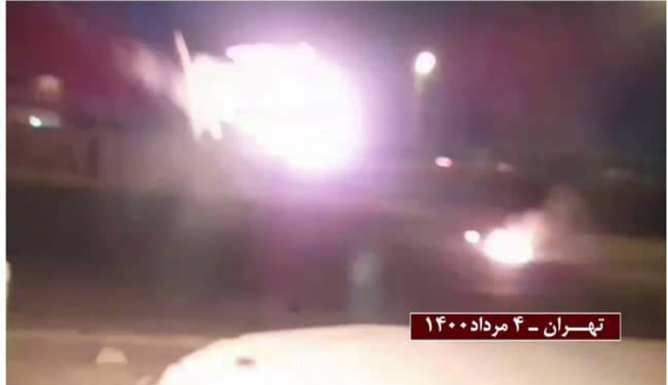
Tehran- July 25, 2021