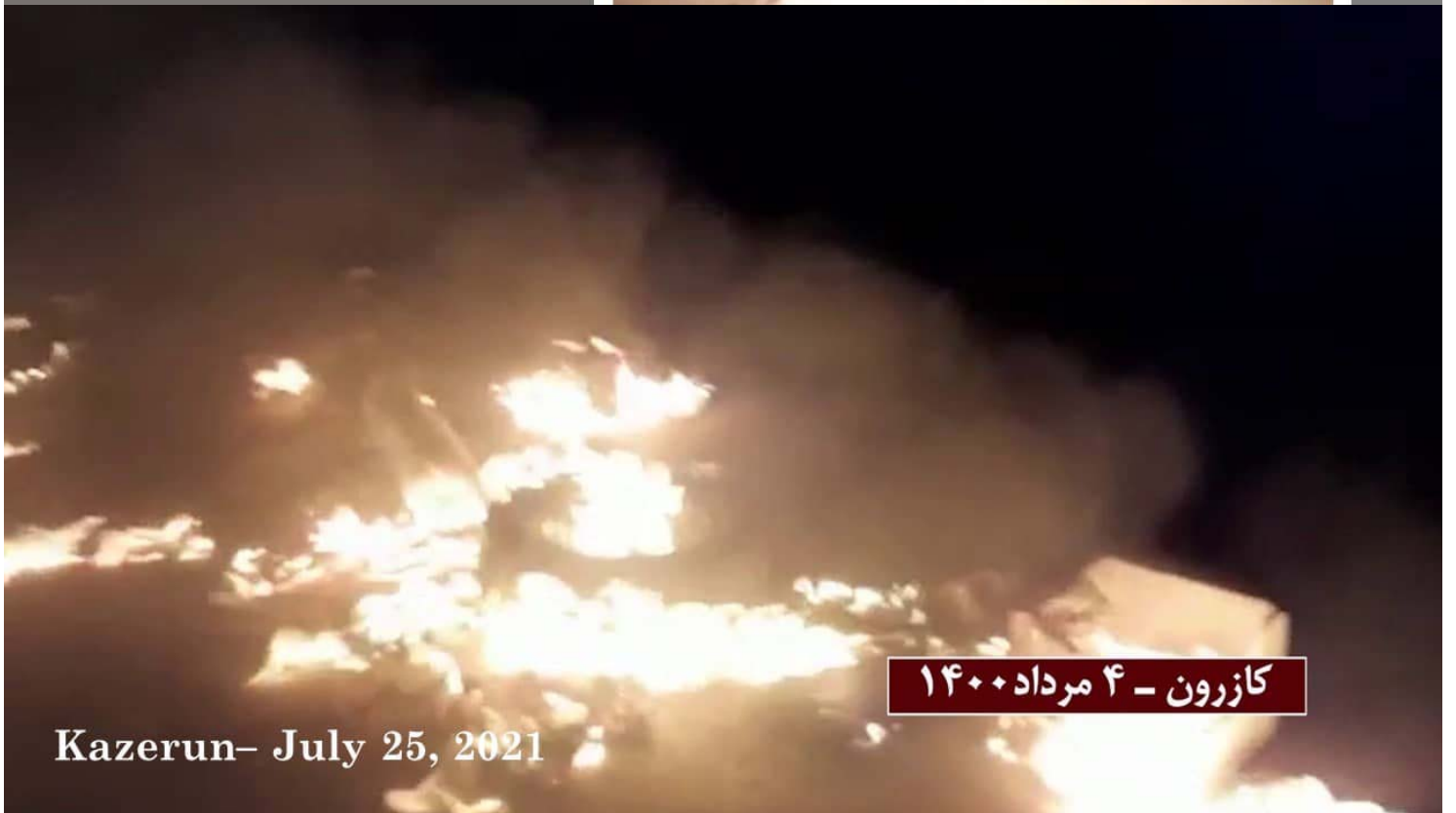
کازرون - ۴ مرداد ۱۴۰۰