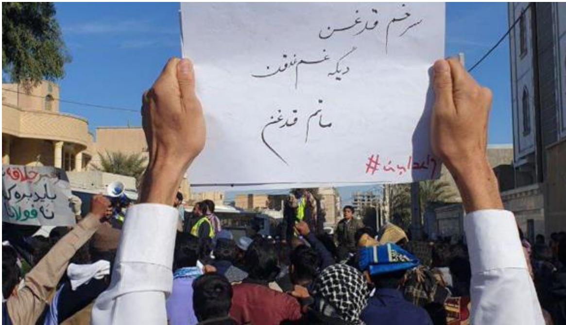
تظاهرات مردم زاهدان ۲۲ اردیبهشت: «سرخم قدغن، دیگه غم قدغن، ماتم قدغن»