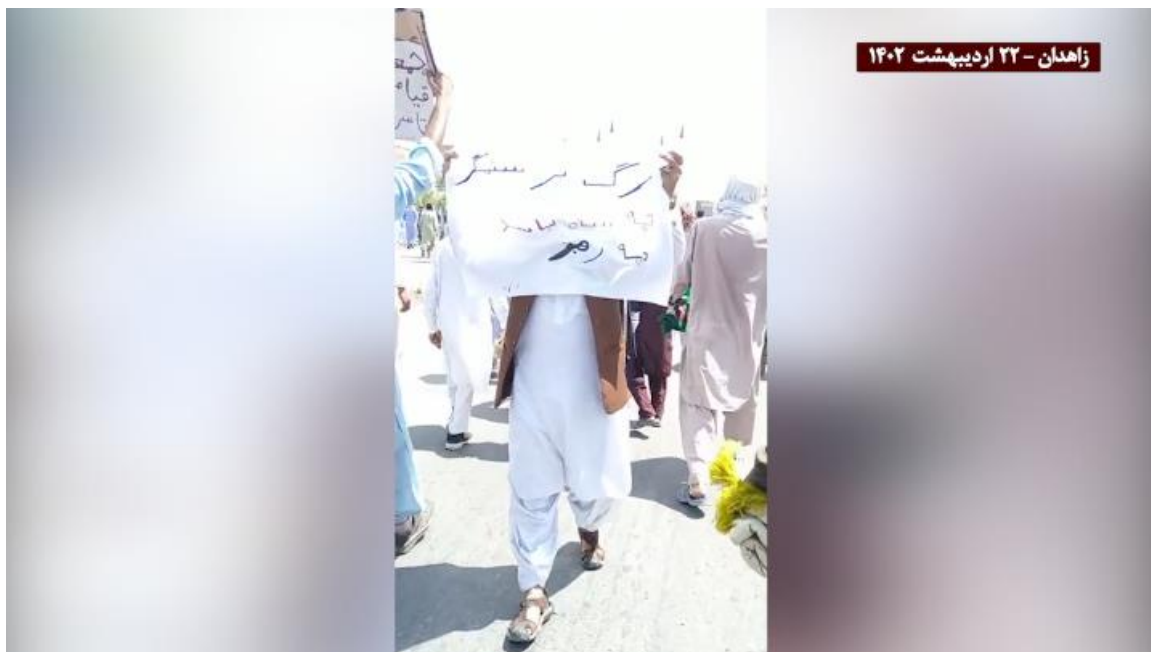
تظاهرات مردم زاهدان ۲۲ اردیبهشت: «مرگ بر ستمگر، چه شاه باشه چه رهبر»