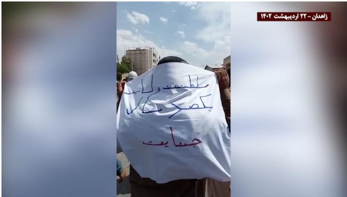
تظاهرات مردم زاهدان ۲۲ اردیبهشت: «سلطنت ولایت، یکصد سال جنایت»