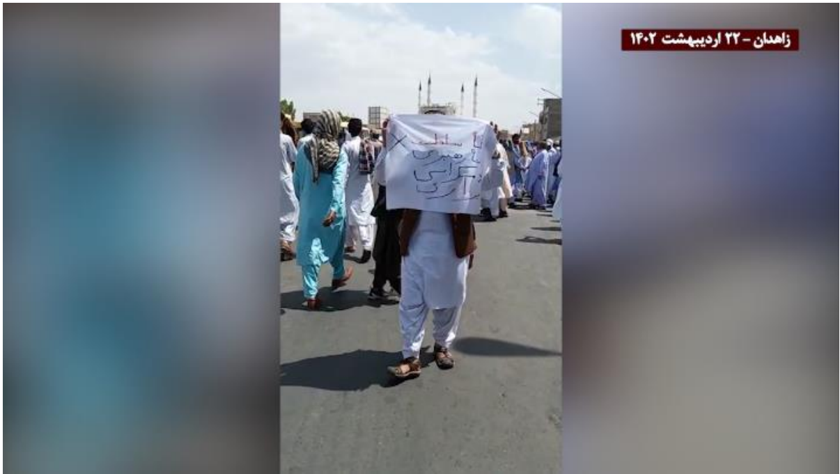
تظاهرات مردم زاهدان ۲۲ اردیبهشت: «نه سلطنت نه رهبری، دموکراسی برابری»